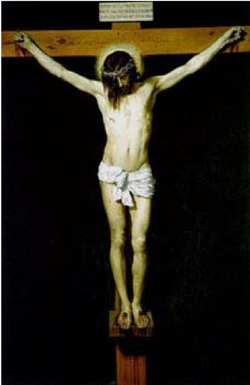
「十字架上のキリスト」(ベラスケス画)